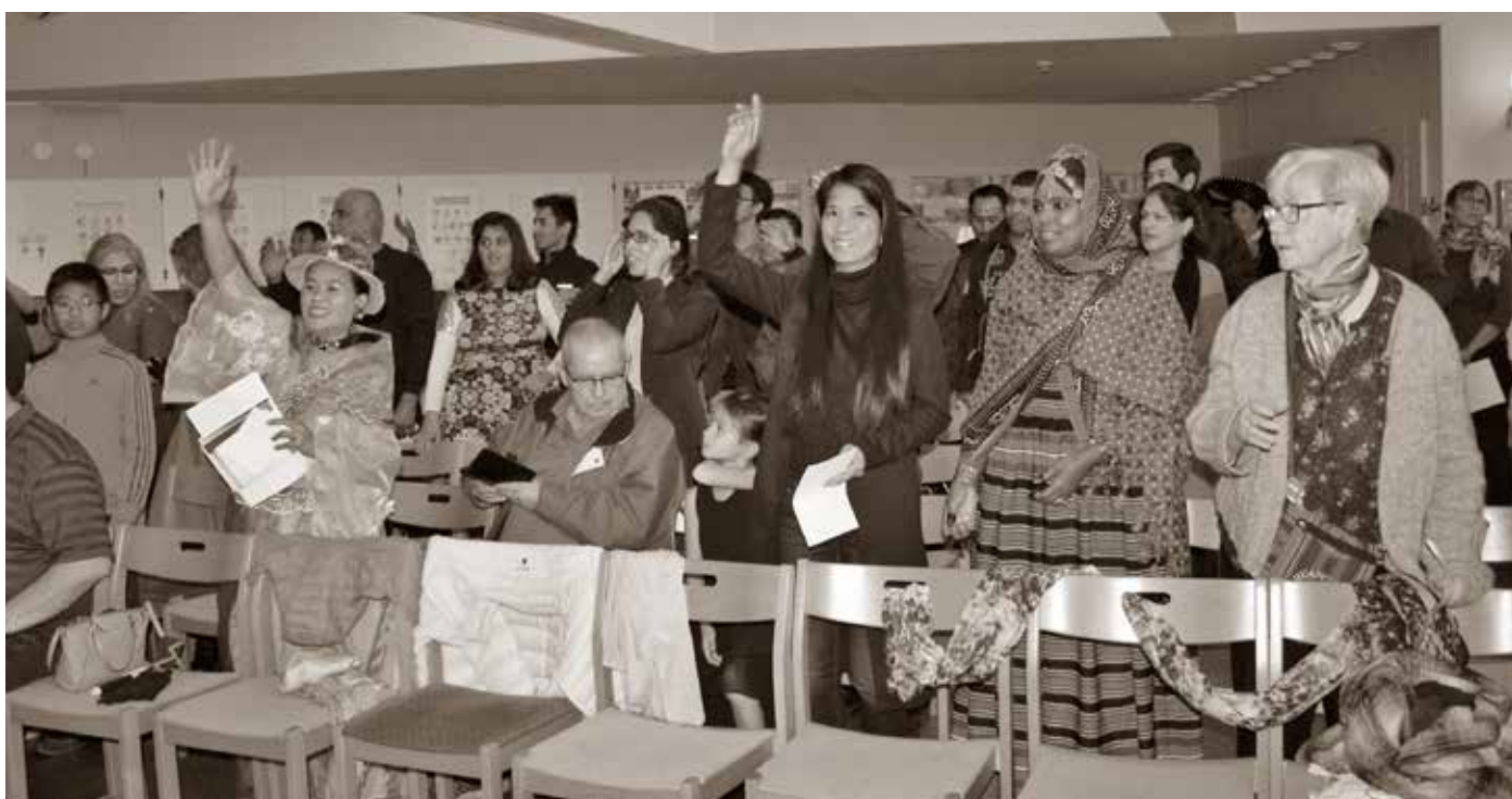
(fra venstre mod højre) Nationernes Fest

Vi – Caritas-gruppen og repræsentanter for sognet – er meget taknemmelige for jer Søstre af Sankt Joseph og for alt det, I er for os, og alt det I gør for os. Vi beder for, at Gud må bevare jer i mange, mange år endnu.