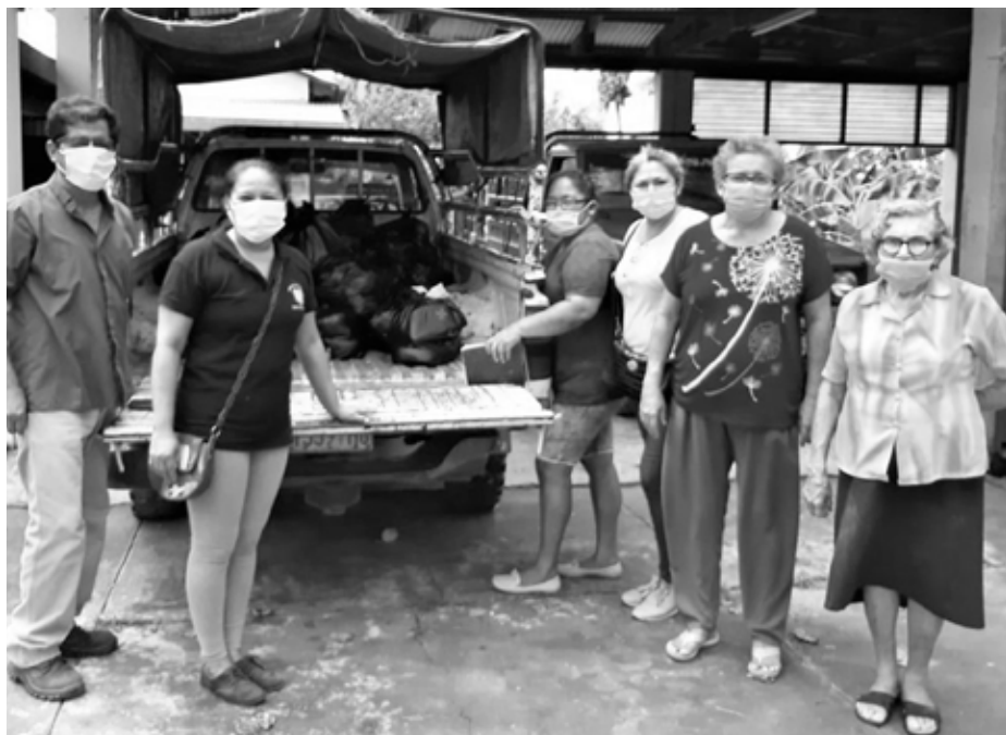
Søstre tjener menigheden

En by med 5000 indbyggere, der kunne rapportere om døde hver eneste dag, stod tilbage uden autoriteter, medicin, mad, transport og finansiel verden, fordi alle i en bank var smittede. Vi fik med hjælp fra venner skaffet noget medicin til de fattige, der havde influenza. Vi delte også den lille