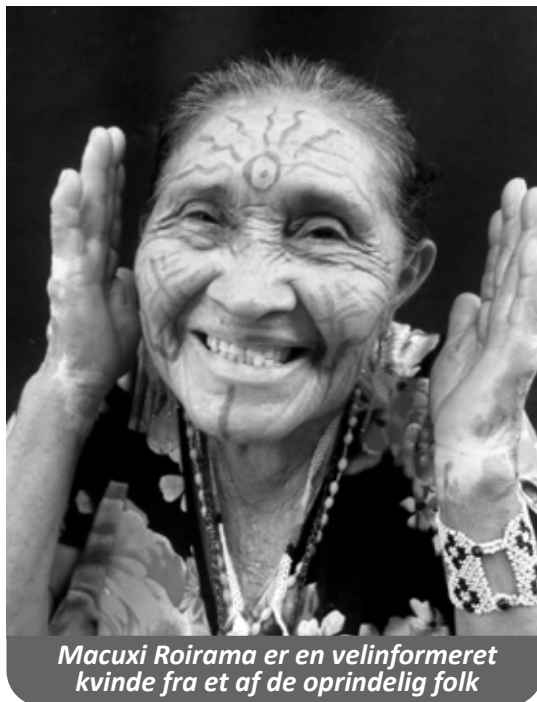
Macuxi Roirama er en velinformeret kvinde fra et af de oprindelige folk

April, maj, juni og juli måneder gik og tog livet af familie og venner,