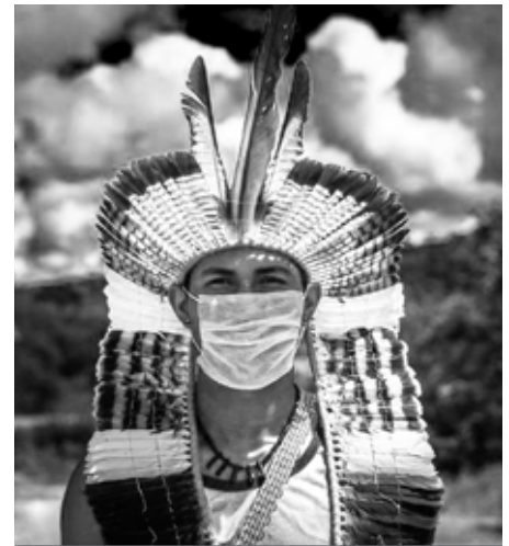
Oprindelige folk i Dorados

som blev syge og forlod os, mange lærere, ældre med stor viden om forfædrene, ledere, børn... alle blev begravet i stor hast i byen uden, at der var tid til at udføre de ritualer, som hvert folk har, for at de døde kan hvile. Det lagde endnu en dyb lidelse til de allerede foruroligende scenerier, der blev skabt af ignorance overfor sygdommen og den misinformation om