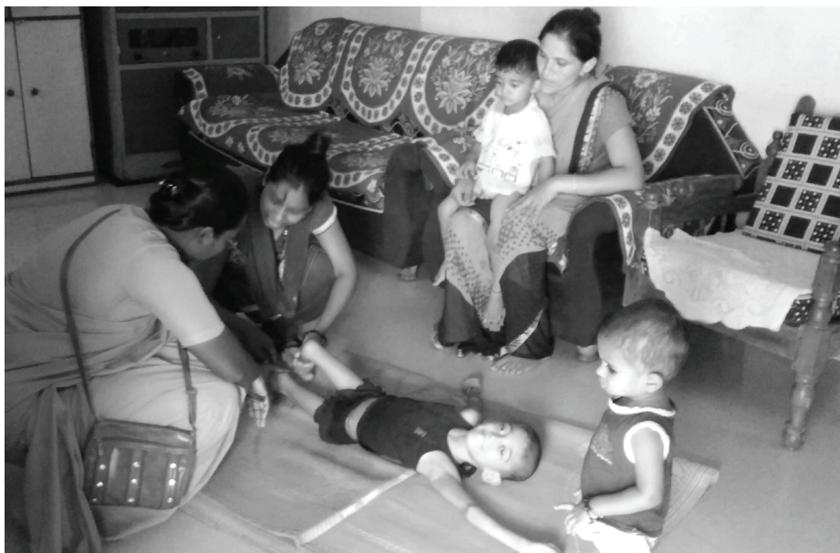
Sr. Prabha med en familie hun hjælper med pleje af en dreng

Disse mænd og kvinder har forskellige medicinske og spirituelle