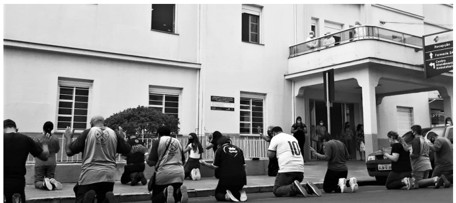
En af gruppe af religiøse fra forskellige kirker beder foran hospitalet

Til disse pressekonferencer inviterede vi alle kristne kirker til at deltage i en fællesbøn, hvor vi bad Gud om hjælp til at stoppe den frygtelige pandemi. I en måned kom kirkens folk to eller tre gange om ugen og stod foran hospitalet for at bede. Kraften i bønner har lettet vores træthed og givet os mere mod, styrke og over alt andet: tro. Vi tror, at Gud hører skrigene fra hans folk og vil stoppe denne pandemi, som påvirker hele menneskeheden og ødelægger liv over hele verden.