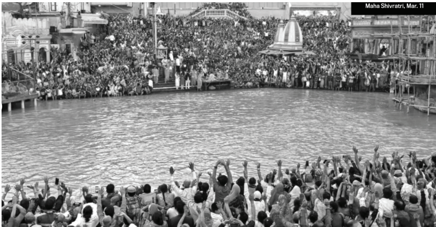
Maha Shivratri, Mar. 11

struktur, der tidligere var etableret i sundhedsvæsenet, mindsket antallet af testlaboratorier og man gjorde ikke noget ud af smitteopsporingen. Endvidere blev genetisk kortlægning ikke prioriteret end ikke efter, at der opstod bekymringer for, at det var en muteret virus, der var årsag til anden bølge. Og så blev problemet med det manglende sundhedspersonale og mangel på ilt aldrig forsøgt løst. Udrulningen af vacciner gik meget langsomt, selvom Indien har en ledende rolle i vaccineproduktionen, og medicin,