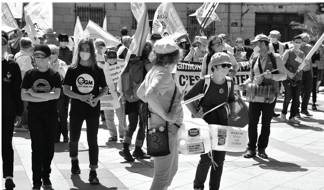
Gruppen demonstrerer for retfærdighed og klima i Chambéry

Der var en stor gruppe af mennesker, der marcherede og krævede, at regeringen forbedrede loven. Denne lov er baseret på forslagene i borgernes klimakonvention skrevet af et upartisk organ bestående af borgere, som står overfor følgerne af klimaforandringerne dag efter dag i vores samfund.