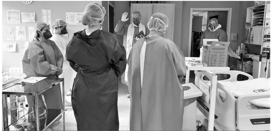
Sr. Adelide (fra højre mod venstre) ledsager biskoppen ved velsignelsen af de syge

I starten kom få Covid-19 patienter, men da den første Covid-19 patient døde, kunne vi på hele hospitalet mærke den triste virkelighed.