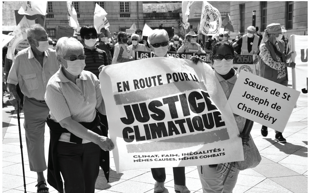
Søstre marcherer for retfærdighed og klima

Fra maj til juli forsøger teamet igen at rette fokus på forskellige miljømæssige temaer ved at bruge både Laudato Si og FN's mål for en miljømæssig