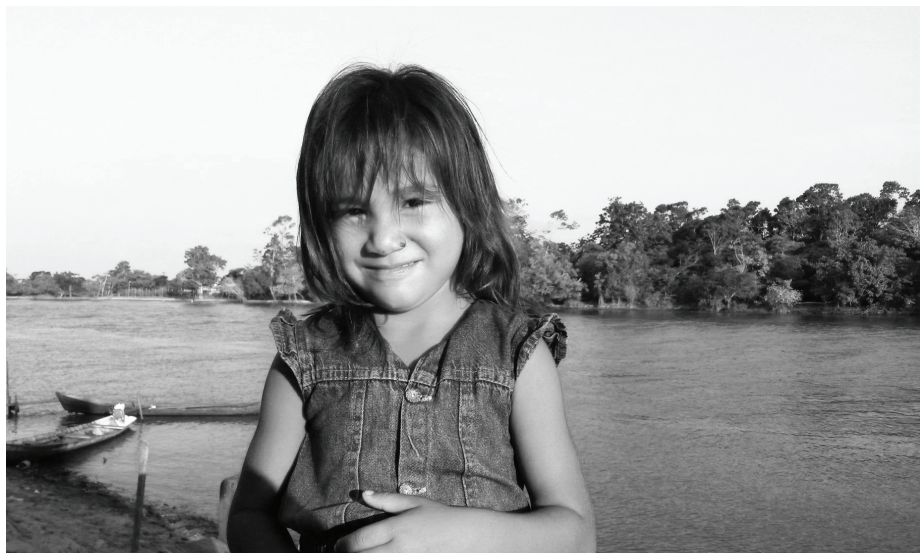
En pige fra Amazonas-regionen

K onferencen for Ordensfolk i Brasilien afholdt et nationalt seminar i april måned for at reflektere over og fordybe sig i to temaer, der er relevante for den aktuelle situation nemlig dokumentet, der er frugten af Amazonas-synoden "Querida Amazonia" og rundskrivelsen fra Pave Frans "Fratelli Tutti". Seminaret er en årlig begivenhed og samler ordensfolk fra hele landet. I 2021 havde vi fem seminarer via computeren, og de var organiseret efter regioner. De gav anledning til at reflektere over ordensfolks vigtige bidrag særligt i disse tider med usikkerhed og diverse udfordringer, som pandemien og andre ting i vores virkelighed, har skabt. Temaet blev præsenteret i fire dele: 1) visdommens mystik 2) at høre skriget fra de fattige 3) samarbejde mellem kongregationer og deling af karisme med lægfolk 4) humanisering af relationer. I refleksionen over temaet blev der rejst flere spørgsmål: Hvad rør sig i os, når vi ser den sterile og passive ligegyldighed overfor mennesker, der lever i fattigdom, og migranter på gaderne, som leder efter mad og overlevelse? Hvad med vores bånd af universelt tilhørsforhold, som drivkraft til gensidig medvirken til søster/broderskab? Føler vi også