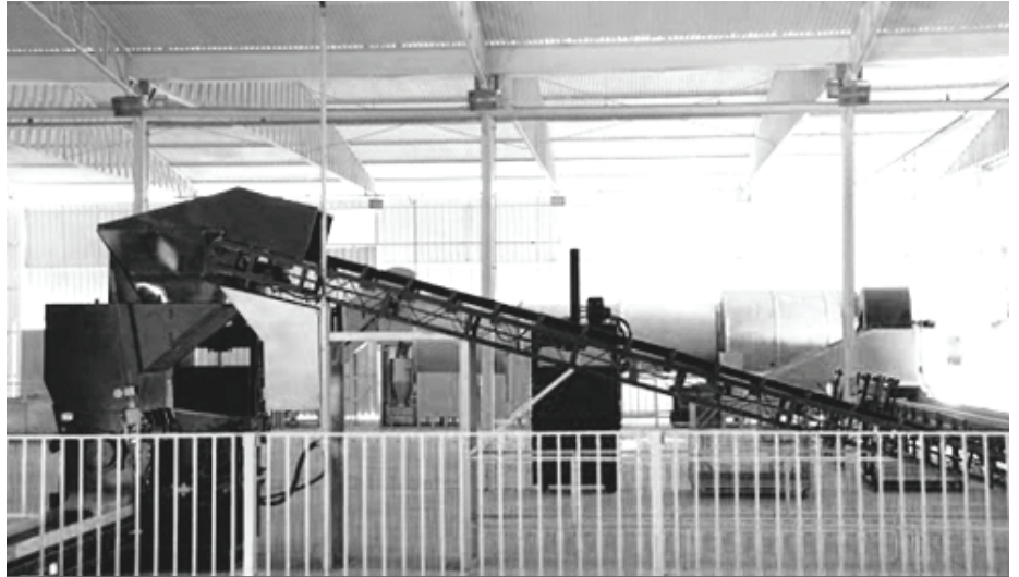
Det første og mest avancerede affaldsanlæg

Udviklingen af informationsteknologien har forværret situationen. I stedet for at blive genbrugt i oprindelseslandet bliver elektronik kasseret og sendt til fattige lande. Ifølge en rapport fra Den Internationale Arbejdsorganisation (ILO) bliver 80% af elektronikaffaldet sendt til fattige lande; for det meste bliver det sendt illegalt. Det er et trist billede og en stor udfordring, vi står over for, og den skal mødes af passende lovgivning. Den gode nyhed er, at når lovgivningen er implementeret, så er der en mulighed for en ordentlig og ren behandling af affald.